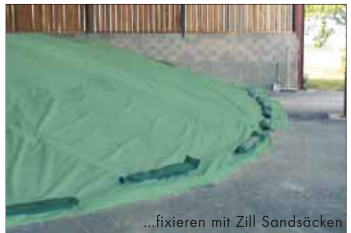
...fixieren mit Zill Sandsäcken

Sie haben Fragen zum Produktsortiment von Zill? Bitte wenden Sie sich an das