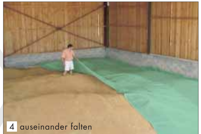
4 auseinander falten