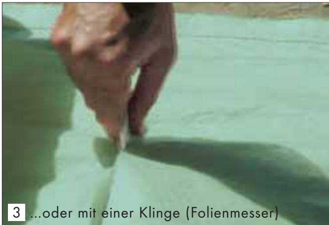
3 ...oder mit einer Klinge (Folienmesser)