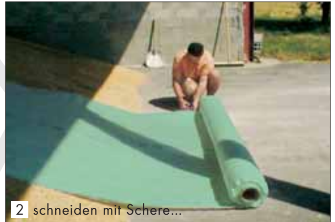
2 schneiden mit Schere...